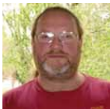
Fabio Barbierato Costumi Corteo Storico