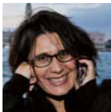
Giovanna Cicogna Comunicazione