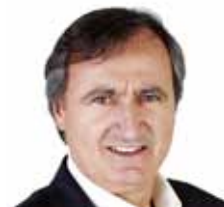
Luigi Brugnarò Primo Magistrato